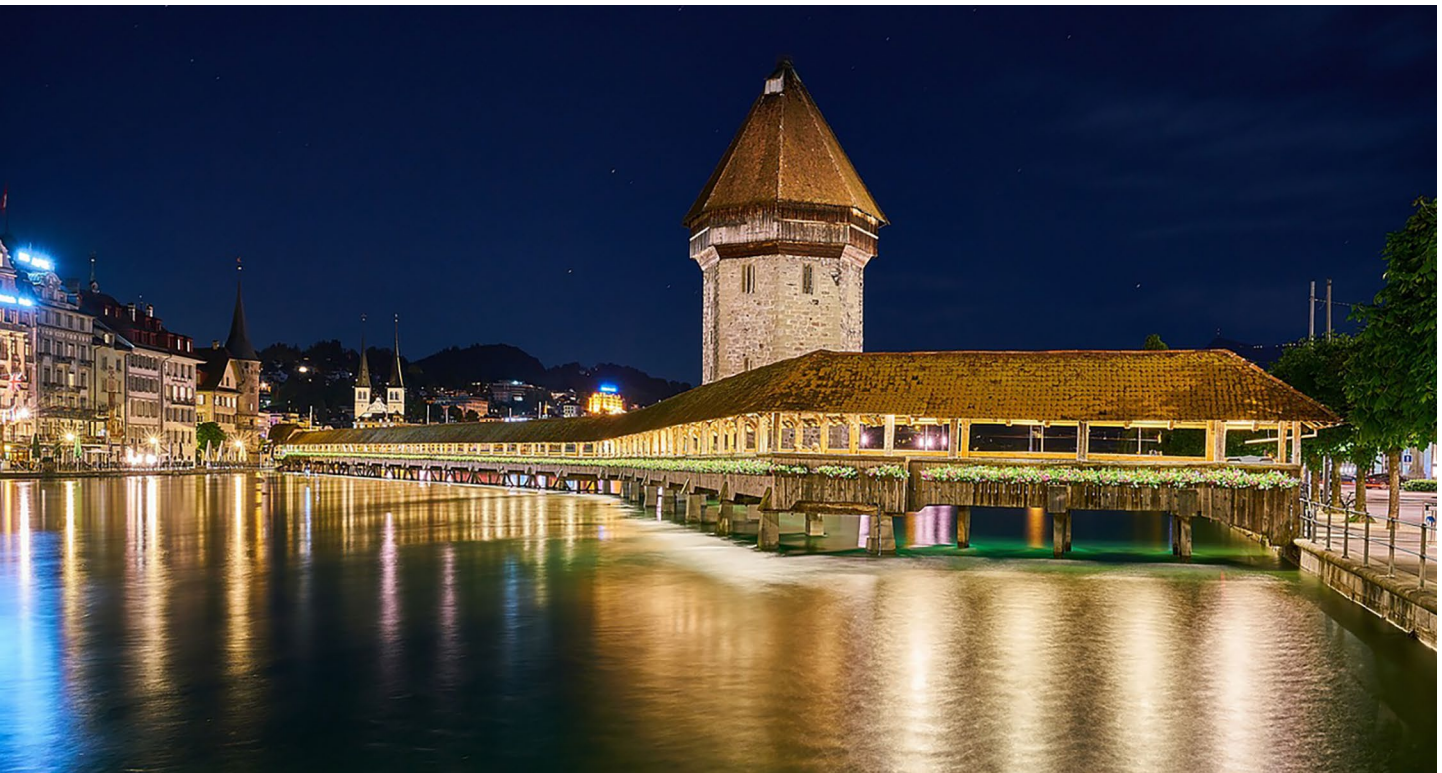
Luzern bei Nacht – hell erleuchtet.

zählern sei kostspielig; Swissgrid sei teurer geworden; die neue Winterstromreserve koste Geld und so weiter.